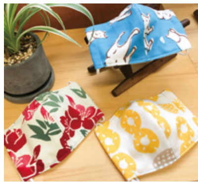
オリジナルマスク 880円税込

毎年この時期には、螢の夕べ、七夕会など季節を感じに「着物でお出かけ」を開催していましたが、お出かけできないのが非常に残念です。気を付けながら、お出かけ出来る日は必ず来ます。その日まで少々お待ちください。