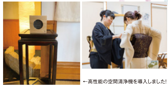
←高性能の空間清浄機を導入しました!

6月から再スタートする事となりましたが、1教室の人数に変更がございます。今までは少人数制として発信していましたが、当面の間、1教室2人までとさせていただきます。そしてコロナ対策として衛生面・距離・空間清浄に配慮して運営して参ります。家から歩出ること、より一層の非日常な着物スタイルを楽しんで頂ければ幸いです。