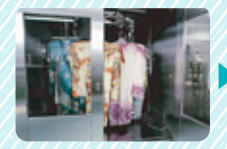
専用虫干し機にてオゾン殺菌と遠赤外線処理加工を行います。