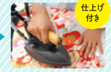
丁寧に仕上げを行います。