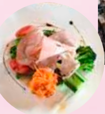
ランチは、人気店「カフェ・ラ・ファミユ」にて!

機織り工房見学 & 結城紬の新作に触れる! 結城紬ができるまでの工程や、洗い張りを使う機械を見せて頂いたりと、色々な角度から結城紬の魅力を楽しみながら学びます。