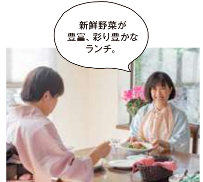
新鮮野菜が豊富、彩り豊かなランチ。