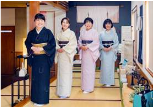
みなさん、上手に着れました〜!!