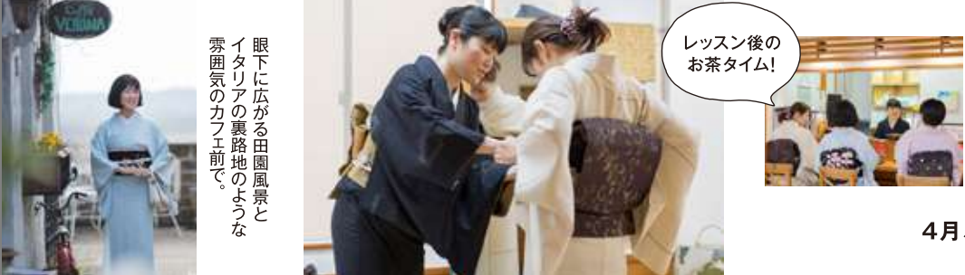
レッスン後のお茶タイム!

新型コロナウイルスの影響もあり、3月は自粛営業を余儀なくしました。新年度4月がスタートし、今もまだ、コロナウイルスが人々を脅かしていますが、治まる時は必ず来ます。私達人間は、大昔から色々な困難に対して、人々と寄り添い、知恵を絞って、大きな変化に対応しながら人間としての成長をしてきたのだと思います。皆様が家族と寄り添う様に、当店も皆様に寄り添える場を守って行く事が最大の目的でもあるので、通常通り、着方レッスン・イベント・売出しなど、安心安全な感染対策をしながら営業して参ります。 店主