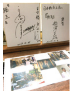
監督さん、出演者さんのサインもありました。

当時18歳だった私は、とにかく東京へ出たいという想いが強く、「着物屋への修行」を口実にして、親へ東京行きをお願いしました。そこで、修業先の呉服屋を、紹介していただいた方が、「東京丸上さん」という日本橋の卸屋でした。