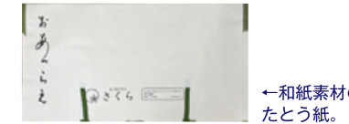
←和紙素材のたとう紙。

湿度が多いこの時期だから、たとう紙のチェックを！ きものを長期保管するうえで、実は「たとう紙」の交換が凄く重要なポイントです。長期にわたり湿気やカビからお着物を守ってくれる和紙がおすすめです。「湿気は着物の天敵」という言葉があるように、風通しの良い部屋での保管、着用後の陰干しが重要です。そして、長期間「たとう紙」を使用していると「黄変やカビ」が発生する場合があります。そのまま放置しておくとお着物に侵入してしまうので注意が必要です。このように、少しの間で大切なお着物を守ってくださいますので是非この機会に「たとう紙」のチェックと、お着物を風を通してあげてください。